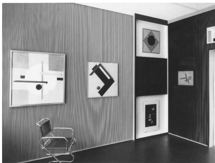
Fig. 1 El Lissitzky, Kabinett der Abstrakten , Landesmuseum di Hannover, 1927

renze, di pensare alla storia dell'arte come ad un processo in costante evoluzione e, allo stesso tempo, di concepire il museo come un luogo non di memoria ma di interpretazione e di costruzione della conoscenza. Al di là, quindi, degli aspetti squisitamente museografici, che possono certamente avvicinare gli allestimenti ideati da Dorner a quelli, altrettanto dinamici, di Frederick Kiesler (Staniszewski, 2001, p. 21), anch'essi giocati sull'attivazione dello spettatore e sulla costruzione di dispositivi d'esposizione avvolgenti e articolati (e basterà ricordare la sistemazione, firmata appunto dall'architetto statunitense nel 1942, della galleria Art of this Century di Peggy Guggenheim) 12 , il progetto che aveva condotto al radicale riallestimento delle collezioni del Landesmuseum di Hannover era un progetto squisitamente museologico, frutto dell'elaborazione teorica consapevole e precisa, talvolta persino eccessivamente argomentata, di uno studioso e, assieme, di un direttore di museo che non senza una qualche malizia è stato ricordato come «a viking philosopher» (Gummere, 1959, p. 159).