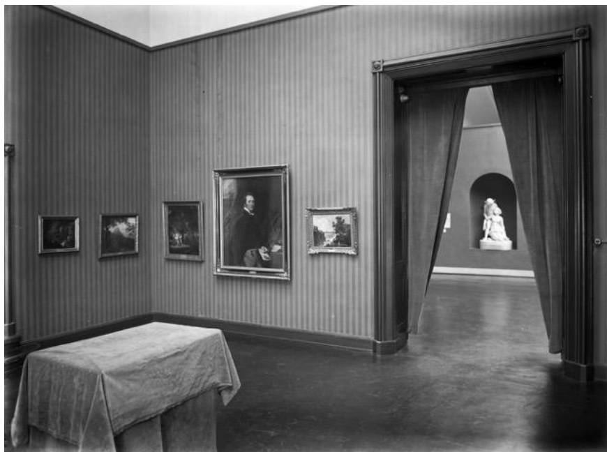
Fig. 4 Alexander Dorner, veduta della Sala Ramberg dopo la sua riorganizzazione, Landesmuseum di Hannover, 1920 circa

(da Tiepolo a Kollwitz) sfidando il pubblico e gli studiosi a distinguere le une dalle altre, venne organizzata dalla Kestnergesellschaft di Hannover, società che rivestì un ruolo decisivo nell'animare la vita artistica della città tedesca e di cui lo stesso Dorner fu direttore dal 1923 al 1924 per poi presiederla dal 1925 al 1933.