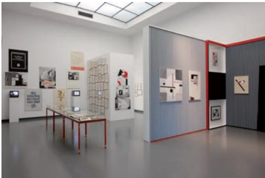
Fig. 2 Veduta dell'installazione del MoAA con la ricostruzione del Kabinett der Abstrakten di El Lissitzky nell'ambito della mostra Play van Abbe: Time Machines - Reloaded , Van Abbemuseum di Eindhoven, settembre 2010 - gennaio 2011

Quello che contava, insomma, è che a manifestarsi attraverso il percorso espositivo fosse l'evoluzione del linguaggio artistico, i cui mutamenti coincidevano secondo Dorner con i cambiamenti, culturalmente e storicamente determinati, della visione. Uno sviluppo che lo stesso Dorner si assumeva la responsabilità di interpretare e di rappresentare attraverso scelte assolutamente soggettive, nella convinzione, espressa con chiarezza in una conferenza del 1927, che mettere in gioco la soggettività, la creatività del curatore rappresentasse una garanzia di efficacia educativa e comunicativa (Ucchil, 2015 p. 42). Così, Dorner non ebbe esitazioni a individuare e indicare al pubblico le macro concezioni spaziali cui era possibile ricondurre le pratiche artistiche che caratterizzavano le tre successive (e progressive) tappe storiche documentate dalla collezione del museo: ai secoli che dall'età del Romanico conducevano al Rinascimento corrispondeva una rigida, «unilaterale» visione di tipo religioso, nella stagione rinascimentale e fino al Romanticismo a dominare era invece la solida prospettiva geometrica e la nuova centralità del soggetto (e certamente non era estranea, in questa lettura, l'influenza di Panofsky), mentre l'età contemporanea si riconosceva nella pluralità dei punti di vi-